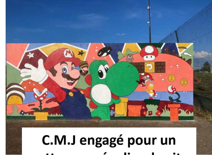
C.M.J engagé pour un nettoyage régulier du city et la décoration du mur