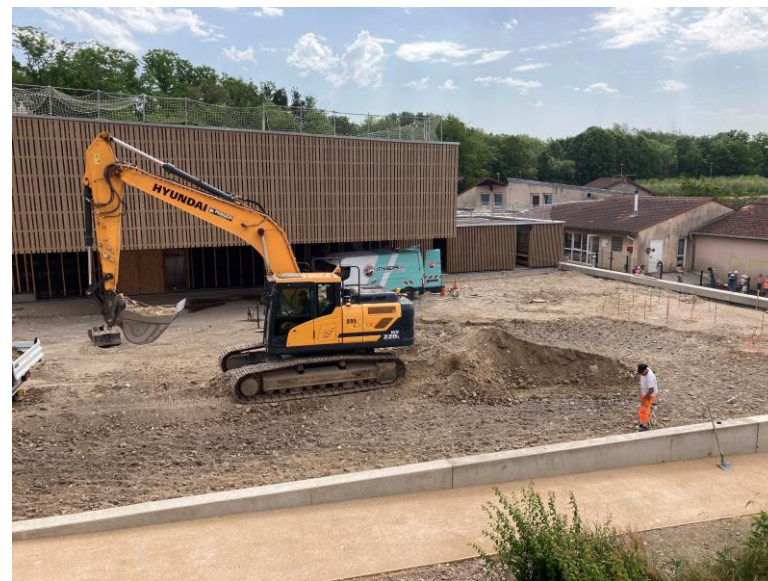
Bassin de récupération des eaux