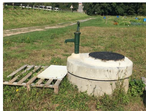
PUITS AUX PAQUIS