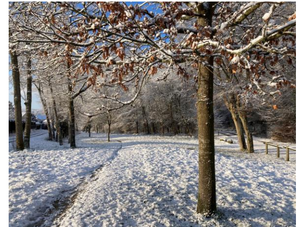
Chemin des étangs