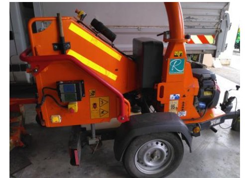
Achat d'un broyeur