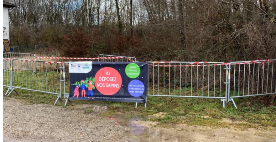
Recyclage des sapins et récupération du compost