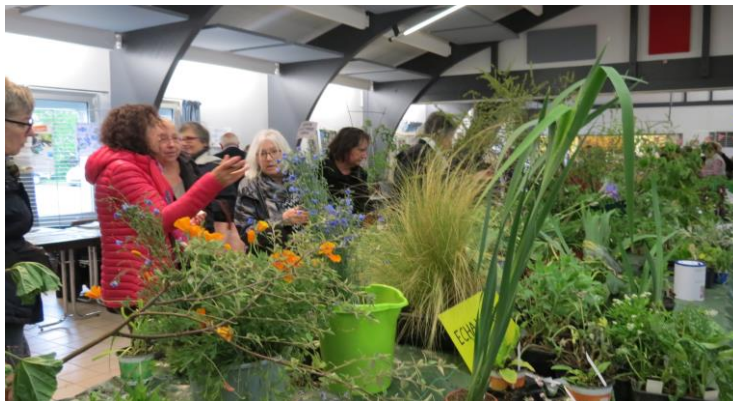
Bourse aux plantes