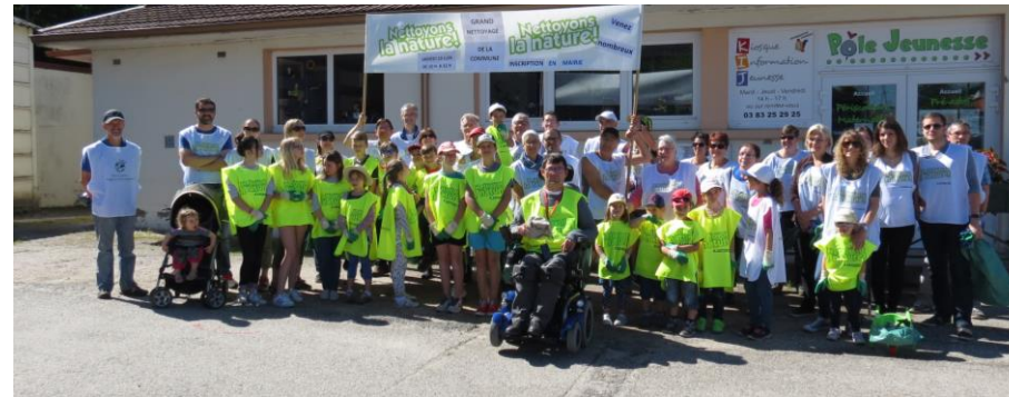
Nettoyons la nature