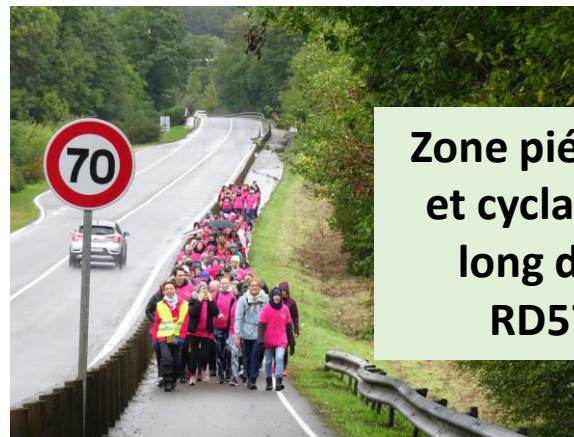
Zone piétonne et cyclable le long de la RD570