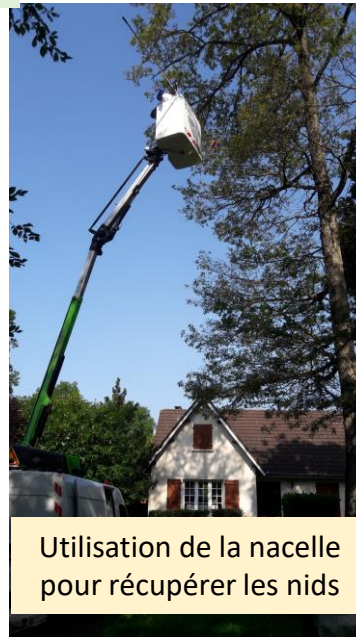
Utilisation de la nacelle pour récupérer les nids

Utilisation de savon noir dilué pour l'extermination des chenilles processionnaires.