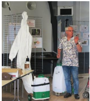
Combinaisons – pulvérisateurs – longues perches