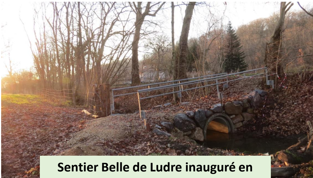
Sentier Belle de Ludre inauguré en 2020 pour rejoindre le canal