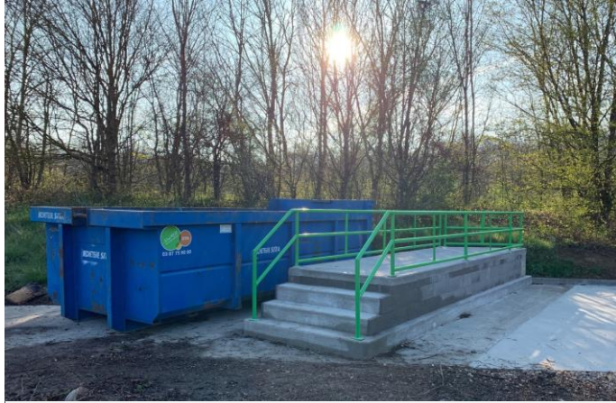
CRÉATION d'un quai facilitant l'accès aux bennes « verte »