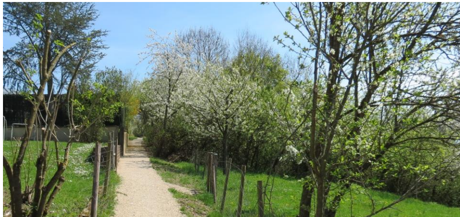
Chemin de La Vaux